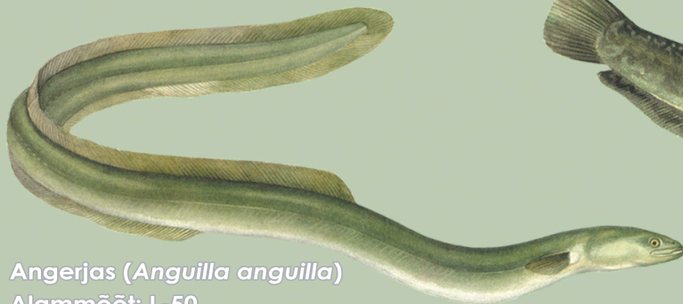
Angerjas ( Anguilla anguilla ) Alammõõt: L-50 Püügikeeld Emajões puudub