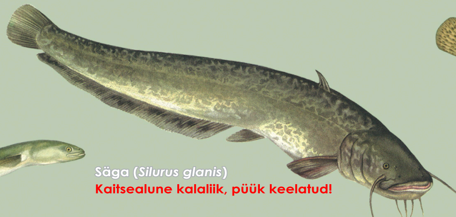
Säga ( Silurus glanis ) Kaitsealune kalaliik, püük keelatud!