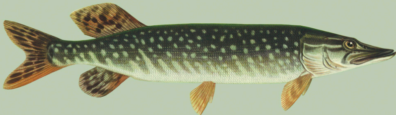
Haug ( Esox lucius ) Alammõõt: I-40 L-45 Püügikeeld: jäävabas vees 15. märts - 10. mai