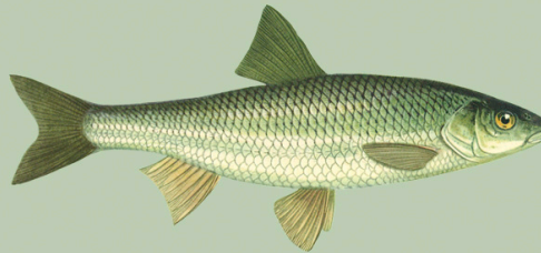
Teib ( Leuciscus leuciscus ) Alammõõt Emajões puudub Püügikeeld Emajões puudub