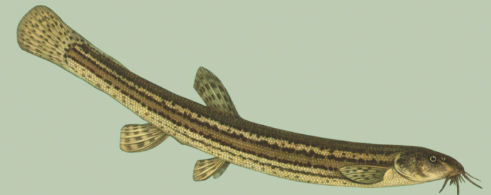
Vingerjas ( Misgurnus fossilis ) Kaitsealune kalaliik, püük keelatud!

Alammõõdud ja püügikeelujad leiad kodulehelt