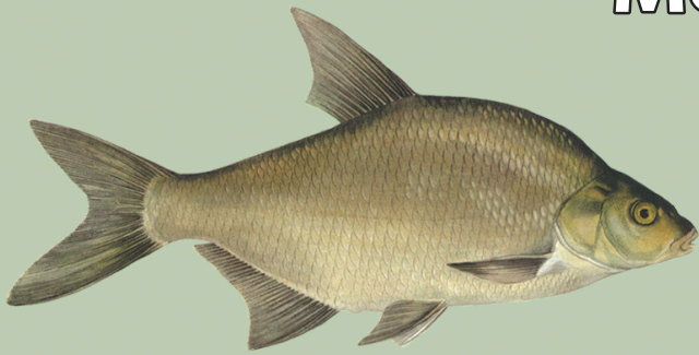
Latikas ( Abramis brama ) Alammõõt: I-30 L-35 Püügikeeld: 1. mai - 20. juuni (välja arvatud püük lihtkäsiõnge, käsiõnge ja tonkaga)