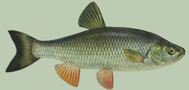
Turb ( Leuciscus cephalus ) Alammõõt Emajões puudub Püügikeeld Emajões puudub