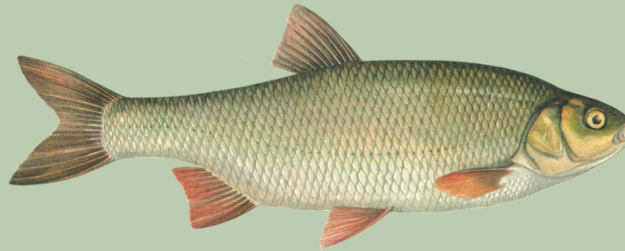
Säinas ( Leuciscus idus ) Alammõõt Emajões puudub Püügikeeld Emajões puudub