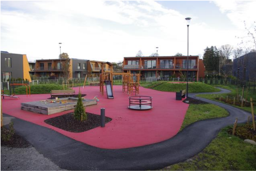
Näide puhke- ja virgestusalast (Kvissentali asumis), mis suhteliselt väiksest pindalast (< 0,2 ha) hoolimata täidab oma eesmärgi