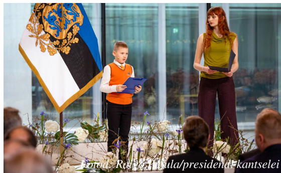
Tartu. Raamatukogu/Presidendi Kantselei